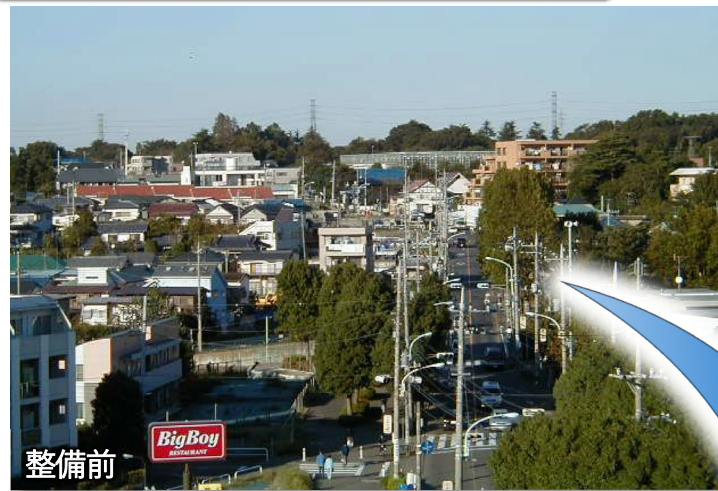
調布3・2・6号 調布保谷線