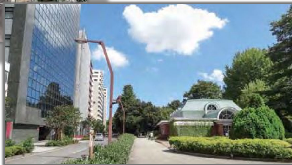
上：新宿御苑トンネル 左：新宿側坑口付近 右：トンネル上部（新宿御苑） 出典：第4回全国街路事業コンクール