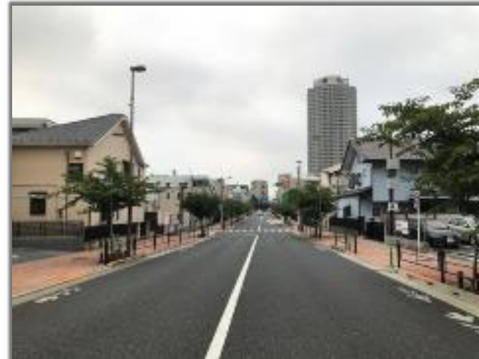
写真は練馬区 区間