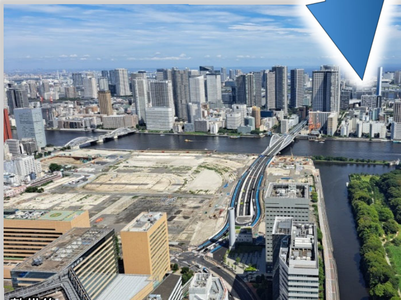
写真は築地・新橋間