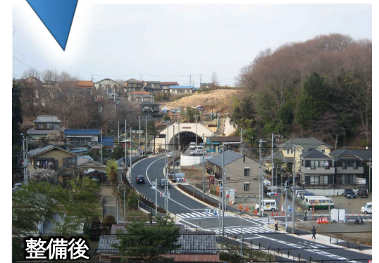
写真は八王子市長房町