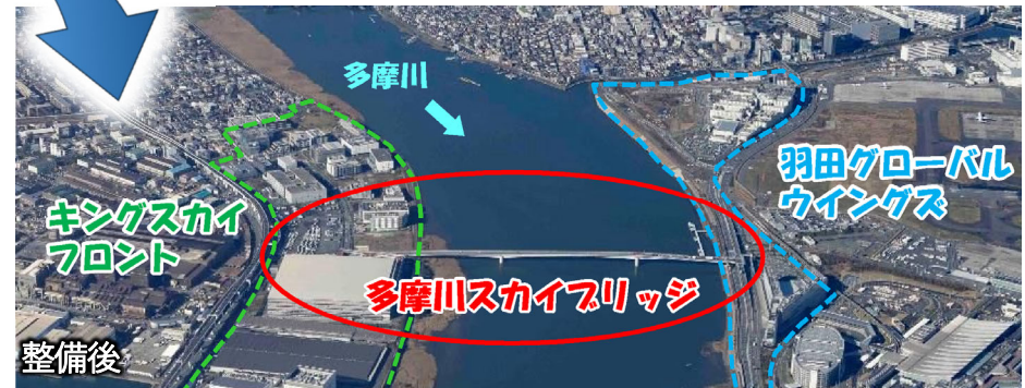
写真は多摩スカイブリッジ