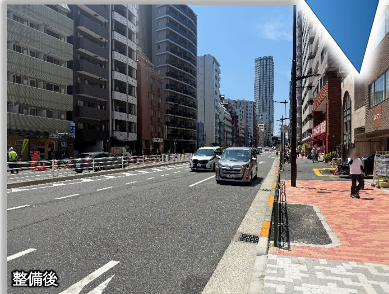
写真は新宿区市谷薬王寺町