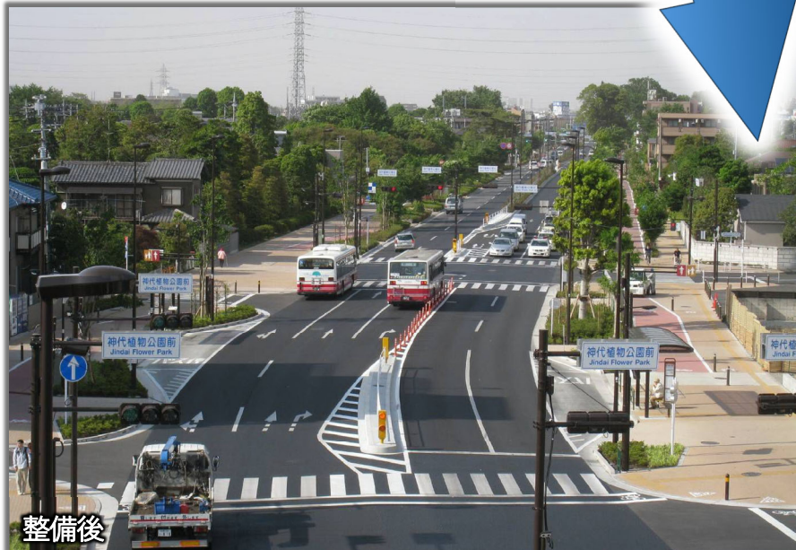
写真は調布市・三鷹市区間