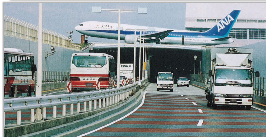
左：北町若木区間（北町若木トンネル） 右上：北町若木区間（板橋相生陸橋） 右下：羽田トンネル