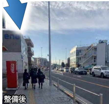
写真は昭島市拝島駅南口