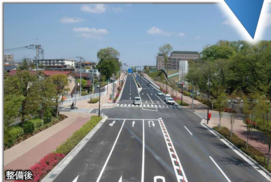
写真は府中市区間