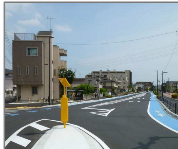
写真は葛飾区 区間