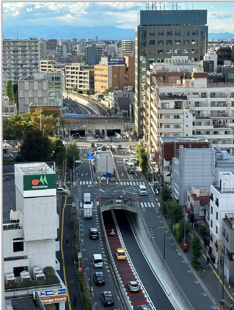
写真は新宿区大久保三丁目から高田馬場四丁目