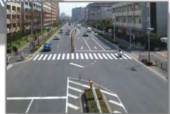
上：清砂大橋 左：江戸川区清新町1丁目付近 右：江東区新砂3丁目付近 出典：第17回全国街路事業コンクール