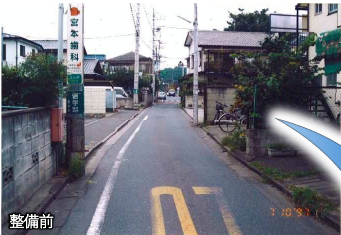
府中3・3・8号 府中所沢線